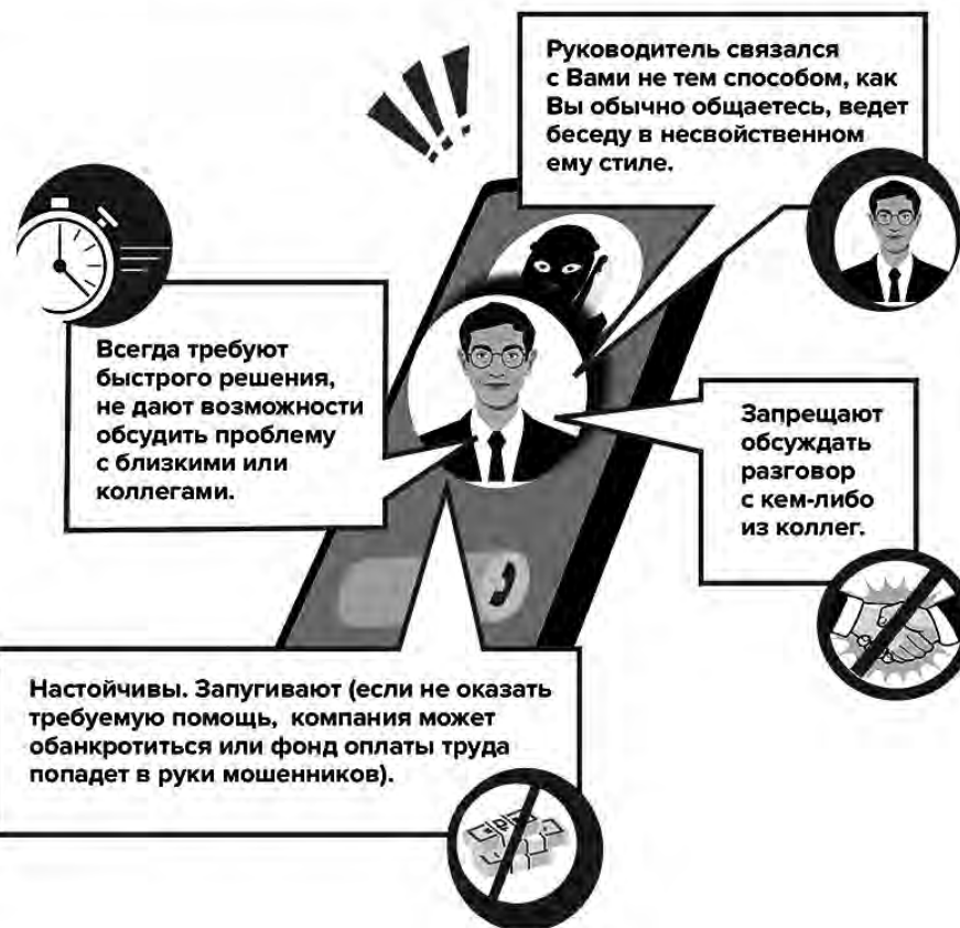
СХЕМА «ЦИФРОВОЙ ДВОЙНИК РУКОВОДИТЕЛЯ»