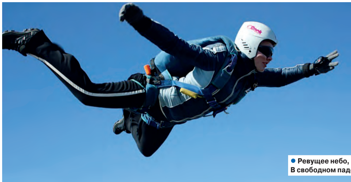
● Ревущее небо, земли дальний круг – В свободном падении воздух упруг!