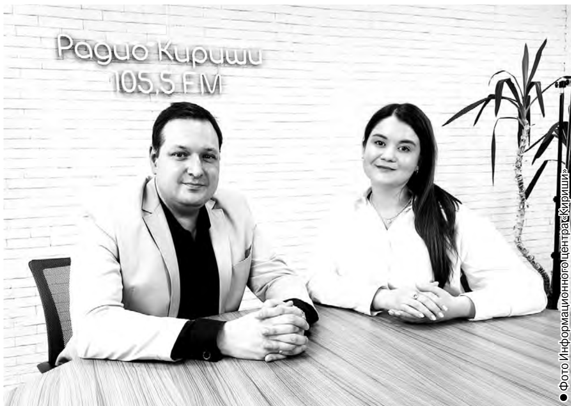
● Разговор состоялся в рамках передачи «20 важных минут» на радио «Кириши»

– Прежде всего, Конституцией РФ и Федеральным законом №183 «Об общих принципах организации и деятельности общественных палат в субъектах Российской Федерации». Также мы опи-