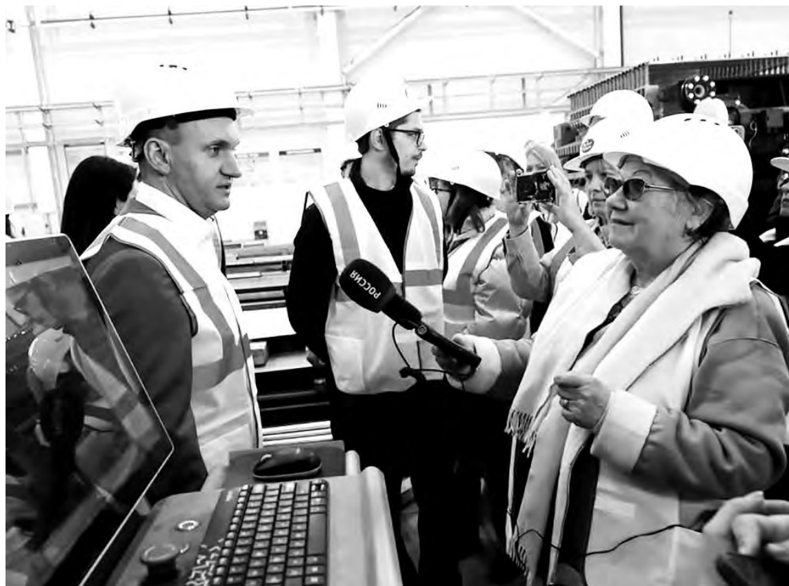
● На заводе «Главсток» журналистам рассказали о планах развития производства