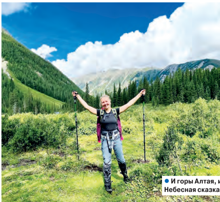
• И горы Алтая, и Гатчины крылья – Небесная сказка становится былью!