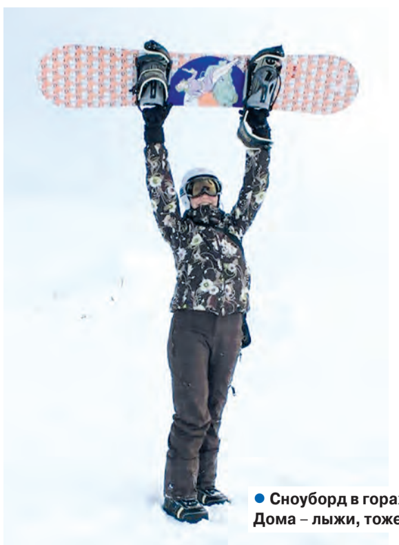
• Сноуборд в горах – считай, крыло; Дома – лыжи, тоже повезло!