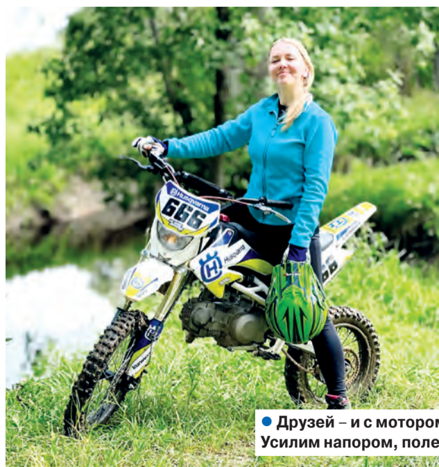
● Друзей – и с мотором, и с мускульной тягой – Усилим напором, полетом, отвагой!

– Сразу замечу, парашютизм, он же скайдайвинг – занятие, которое «подойдет» не всякому экзальтированному романтику. Это одно из направлений авиации, а значит, ошибки и небрежность чреватые серьезными последствиями. Наряду с несомненной готовностью к экстриму на парашютисте лежит высокая ответственность, ставка которой – жизнь и ее дальнейшее благополучие. Первый прыжок для человека, вполне осознающе-