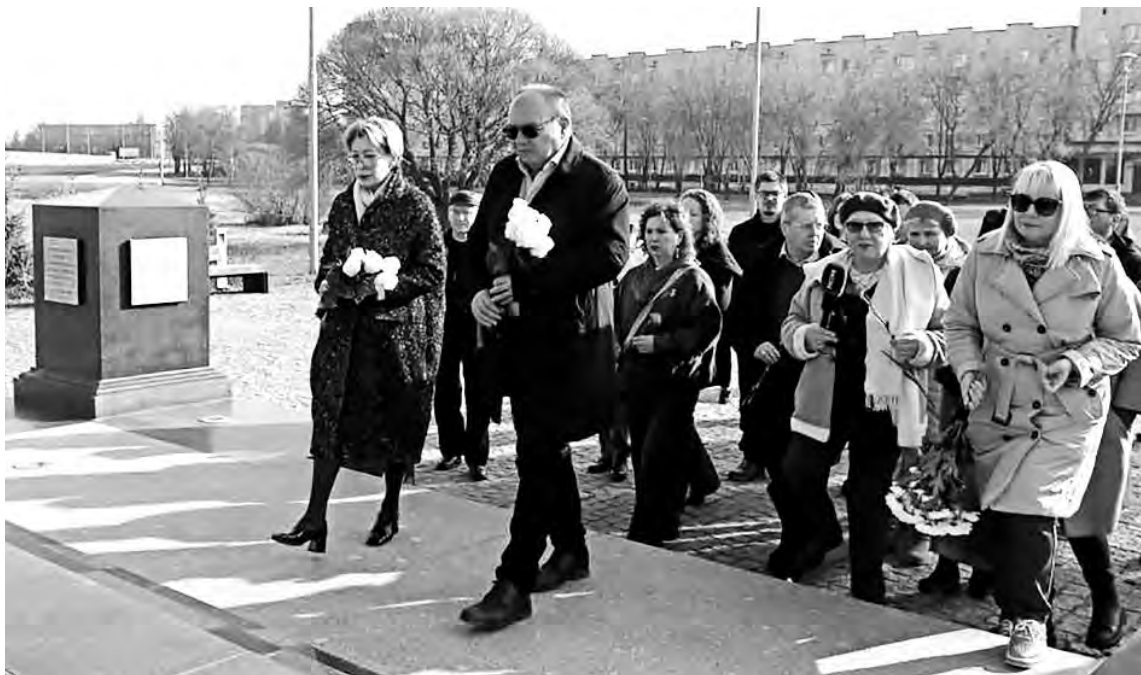
● Возложение цветов к стеле «Кириши – город воинской доблести»