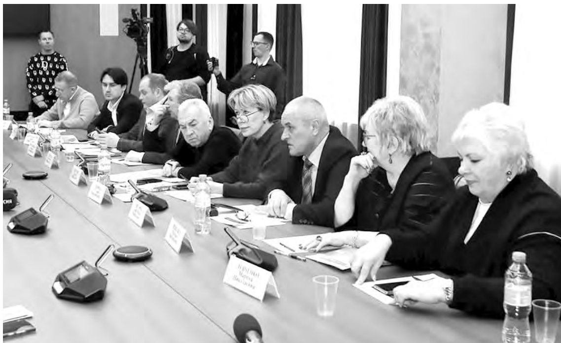
● 26 марта прошла традиционная встреча журналистов с депутатами Законодательного собрания Ленинградской области

Второй день знакомства начался с тишины и проявления уважения к исторической памяти. В парке «Прибрежный» участники семинара возложили цветы к стеле «Кириши – город воинской доблести». Заместитель председа-