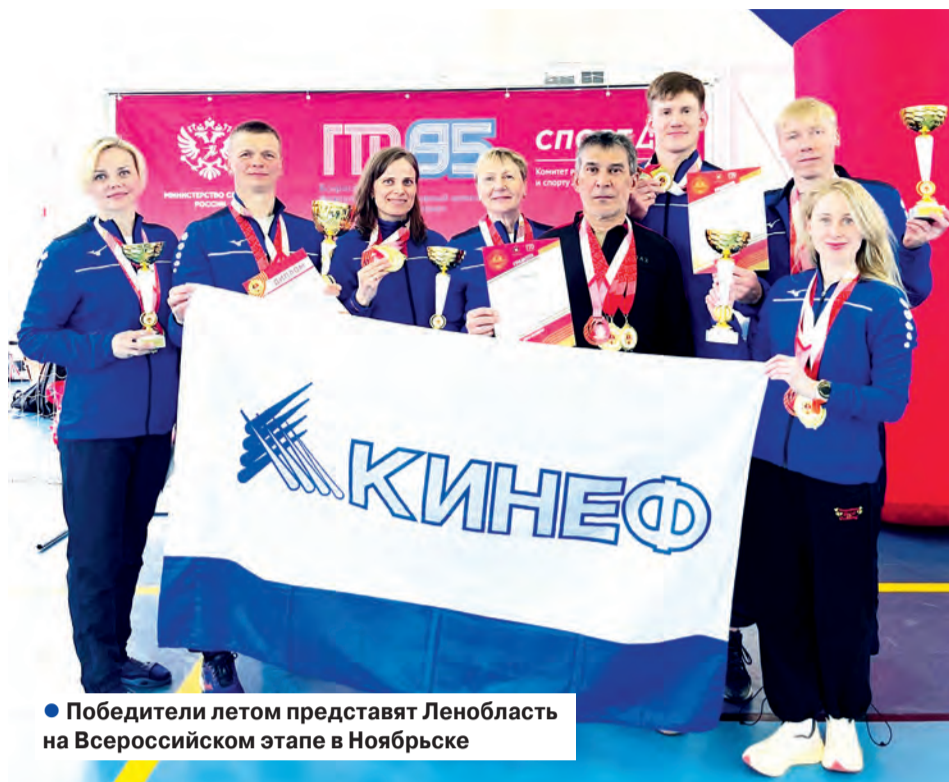
• Победители летом представят Ленобласть на Всероссийском этапе в Ноябрьске