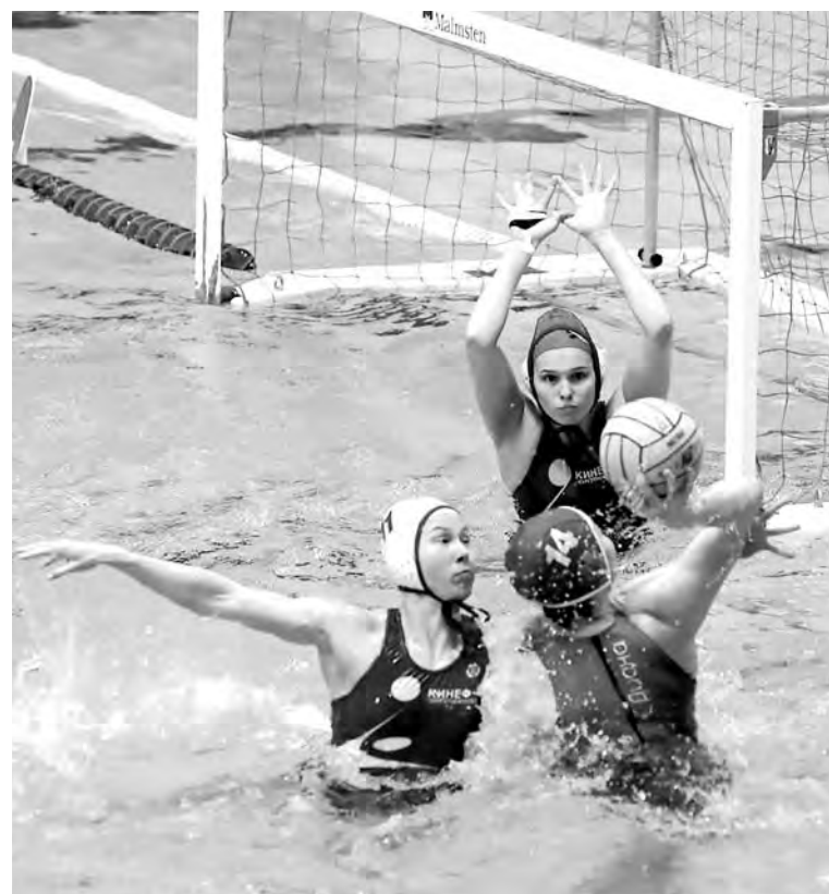
● Матч между командами «КИНЕФ-Сургутнефтегаз» и «Дианой» был по-настоящему захватывающим!