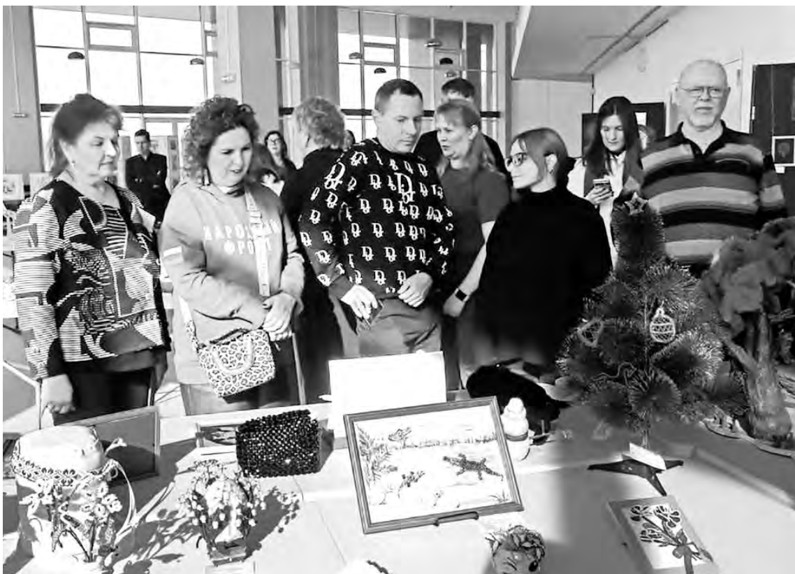
● Главреды Ленобласти во Дворце творчества ознакомились с ежегодной выставкой «Перекресток миров»