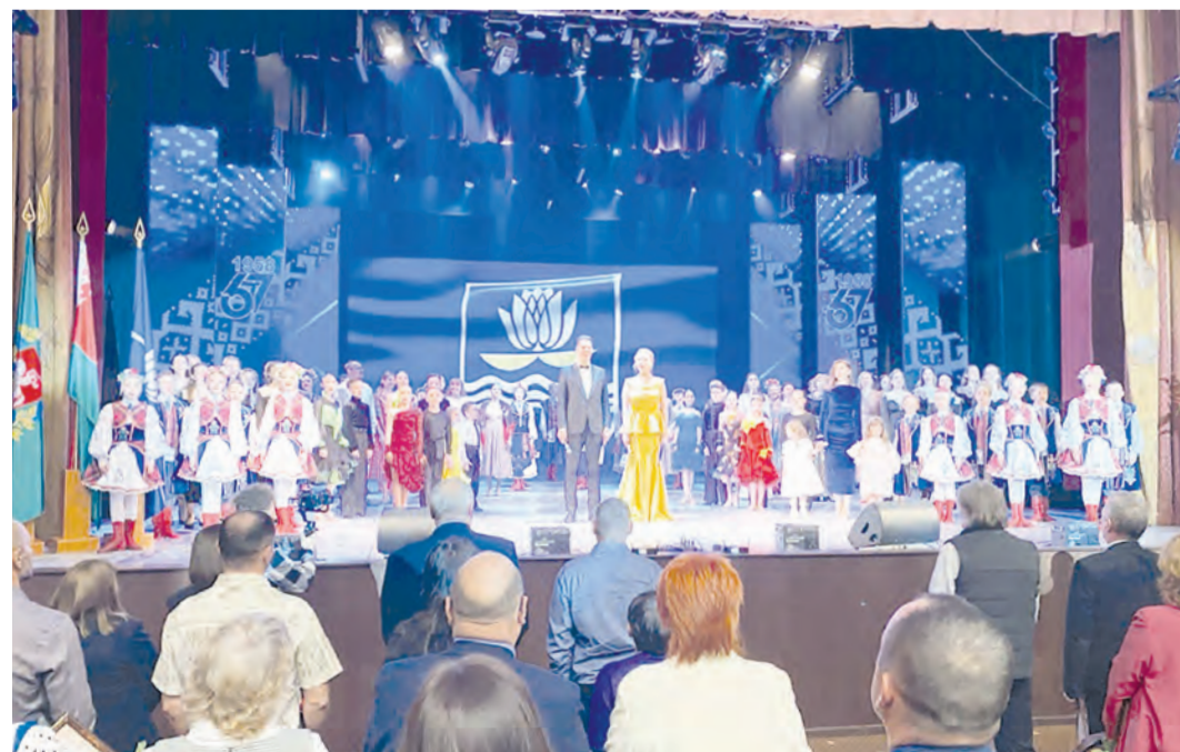
● Звучит гимн города Новополоцка в ДК НАФТАН