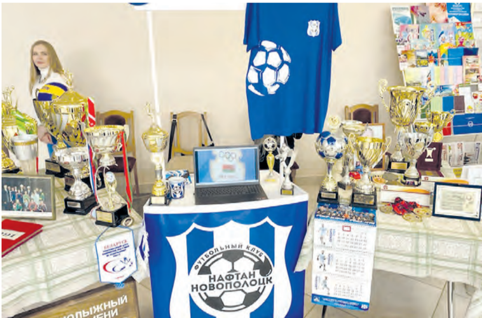
• Гордость Новополоцка - футбольный клуб «НАФТАН-Новополоцк»