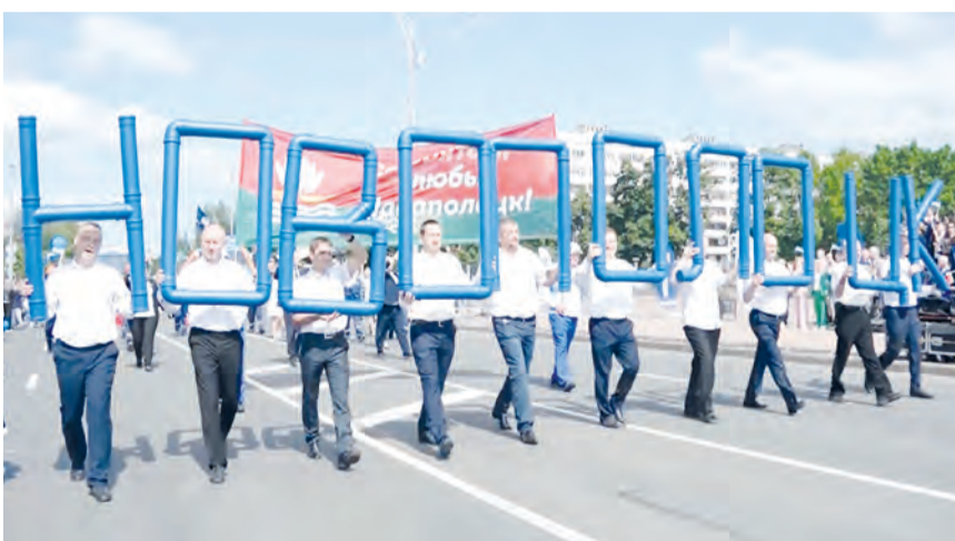
• Фрагменты торжественного шествия