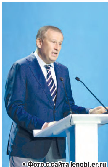
• Фото с сайта lenobl.er.ru

В Сосновом Бору прошла XXXIV Конференция Ленинградского областного регионального отделения Всероссийской политической партии «ЕДИНАЯ РОССИЯ»