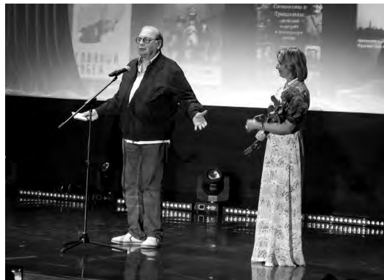
Народный артист РФ Валентин Смирнитский и режиссёр Ольга Акатъева