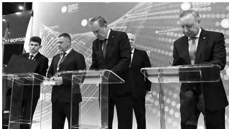
Ленобласть и Санкт-Петербург совместно будут развивать туризм по «пушкинским местам»

Познакомиться с инвестиционным потенциалом и мерами поддержки бизнеса гости могли на «Капитанском мостике» — центральной зоне стенда. С помощью интерактивной панели участники форума выбрали