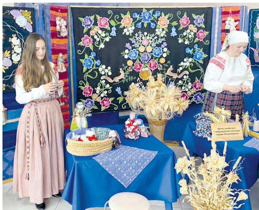
● Выставка достижений располагалась в одном из фойе ДК