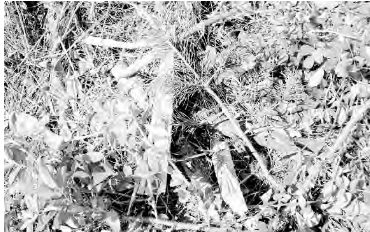
● Как и в сквере Поколений, в Саду памяти на Бестужевых рядом с соснами росли розовые кусты... Теперь ничего не растет