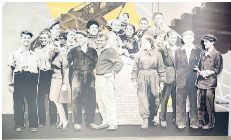
• Инсталляция в музее истории и культуры: фото первостроителей города