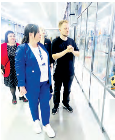
• Экскурсия по музею нефтезавода в ДК НАФТАН