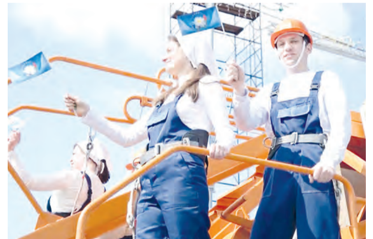
• В шествии по главной улице города принимают участие все предприятия и учреждения города