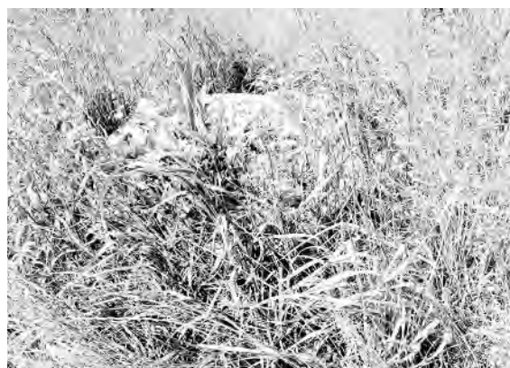
● «На дальней станции сойду – трава по пояс...» Так к Дню России выглядели вазоны и клумбы в Саду памяти на Бестужевых

Со всеми работниками, выходящими на линию, проводится подробный инструктаж о необходимости внимательно и бережно относиться к зеленым насаждениям. По данным фактам проведена беседа. Участку благоустройства поручено внести в план озеленения города на 2026 год посадку сосен в данном сквере и проведение мероприятий по содержанию существующих насаждений».