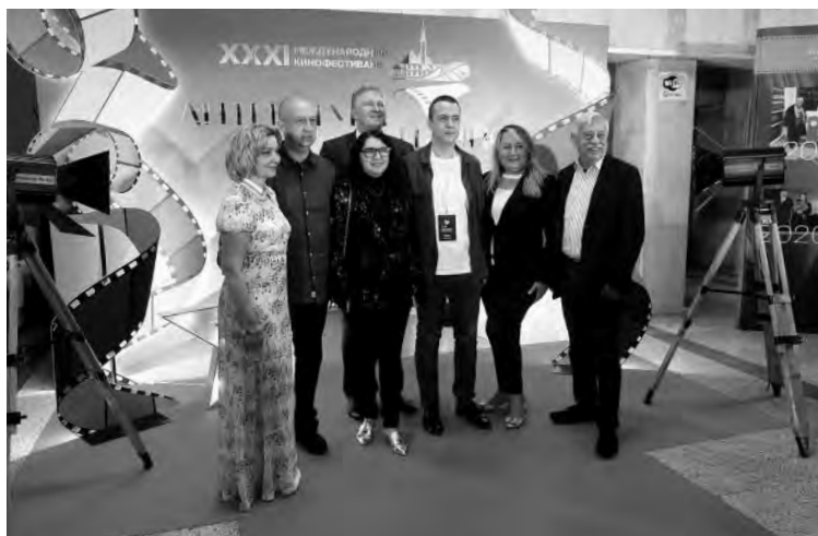
Каждый мог почувствовать себя звездой на красной ковровой дорожке фестиваля