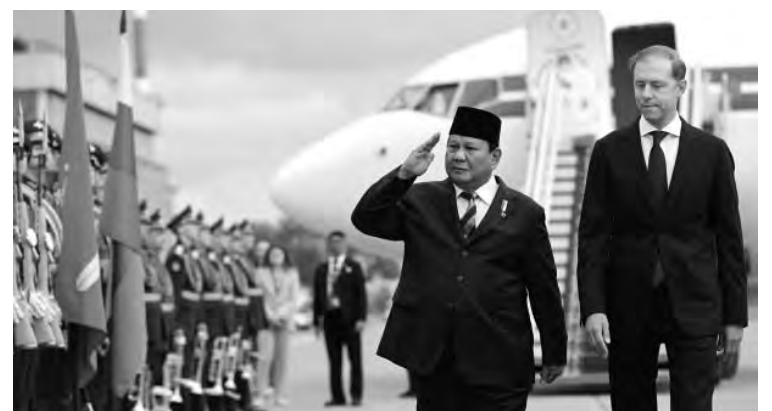
Среди международных гостей форума — Президент Индонезии Прабово Субианто

СТАНИСЛАВ БУТЕНКО ФОТО: ПРЕСС-СЛУЖБА ПРАВИТЕЛЬСТВА ЛЕНОБЛАСТИ