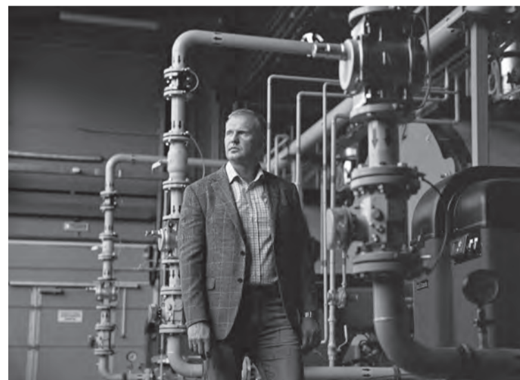
Котельные, построенные Михаилом, работают уже в 7 поселениях

«Энерго-Ресурс» также обеспечивает материалами военные части на территории региона, адресно помогает ветеранам с конкретными проблемами, выделяет средства на подарки для