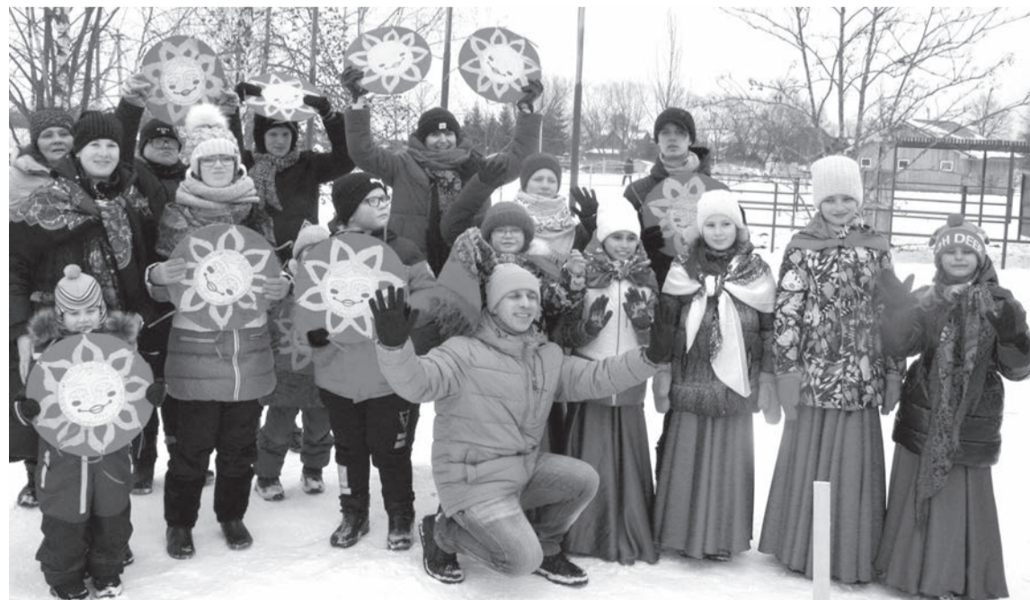
Подопечные центра широко отпраздновали Масленицу

АЛЕКСАНДР ГРУШИН ФОТО: КСК «НОВОПОЛЬЕ», АЛЕКСАНДР ГРУШИН