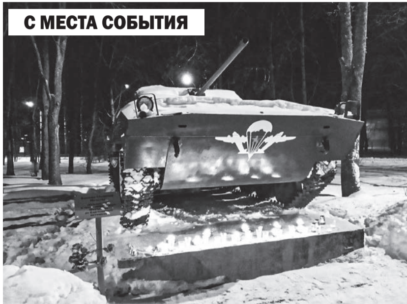
С МЕСТА СОБЫТИЯ