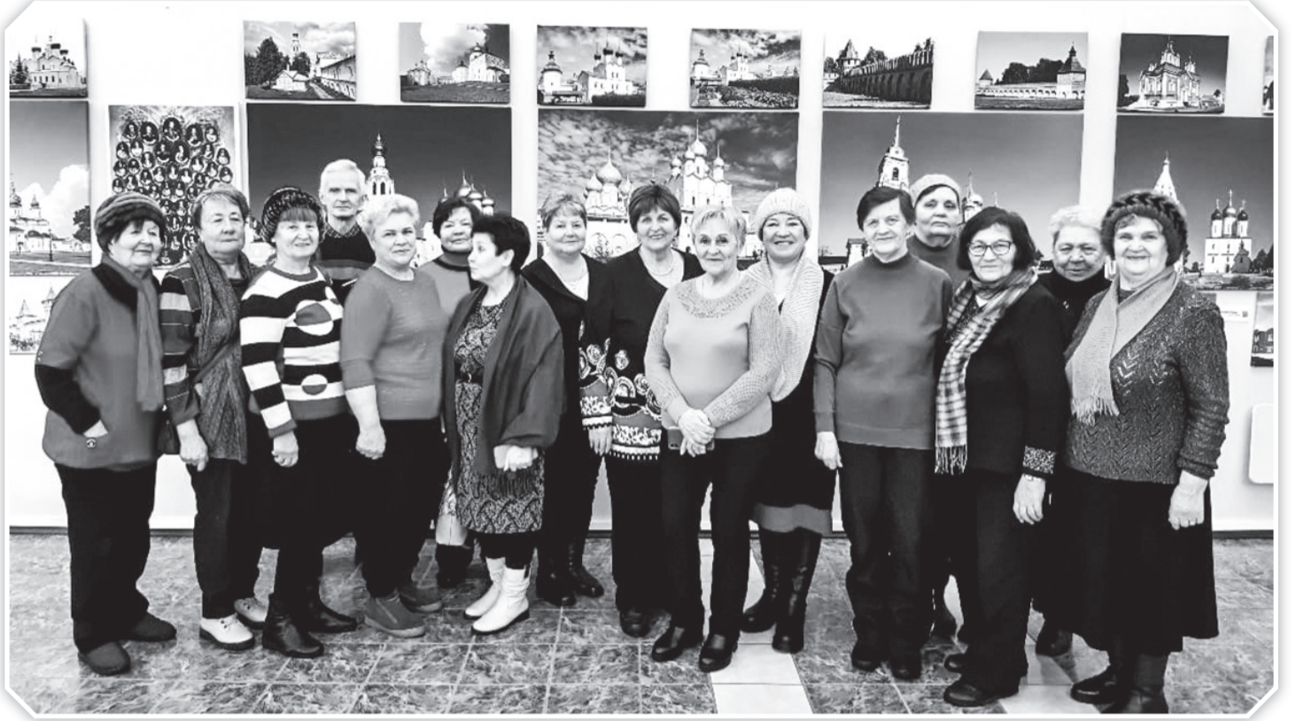
• Выставка в Культурно-информационном центре им.А.С.Пушкина понравилась всем

От ветеранов Киришского района мы возложили цветы к памятнику-стеле мемориала «Валимский рубеж», где осенью 1941 года насмерть стояли советские воины 54-й армии под командованием генерала И.И.Федюнинского. Они не позволили фашистами замкнуть второе кольцо блокады Ленинграда. Дальше этих траншей враг не прошёл.