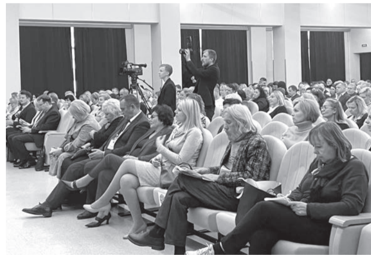
На мероприятиях Союза женщин всегда рады видеть мужчин

БЕСЕДОВАЛ АЛЕКСЕЙ АСТАПЧИК