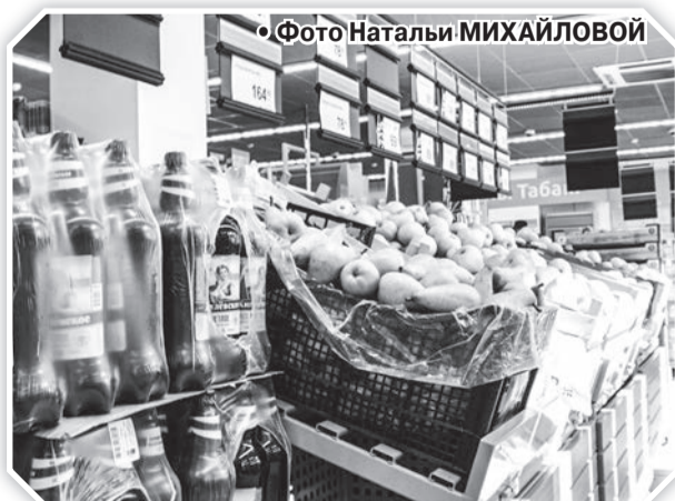
• Фото Натальи МИХАЙЛОВОЙ

Неравнодушные люди города Кириши и района