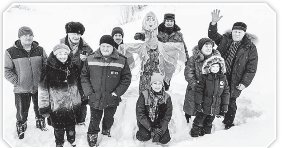
• Чучело Масленицы было очень красивое. Многие сфотографировались с ним на память

Жители деревни Витка