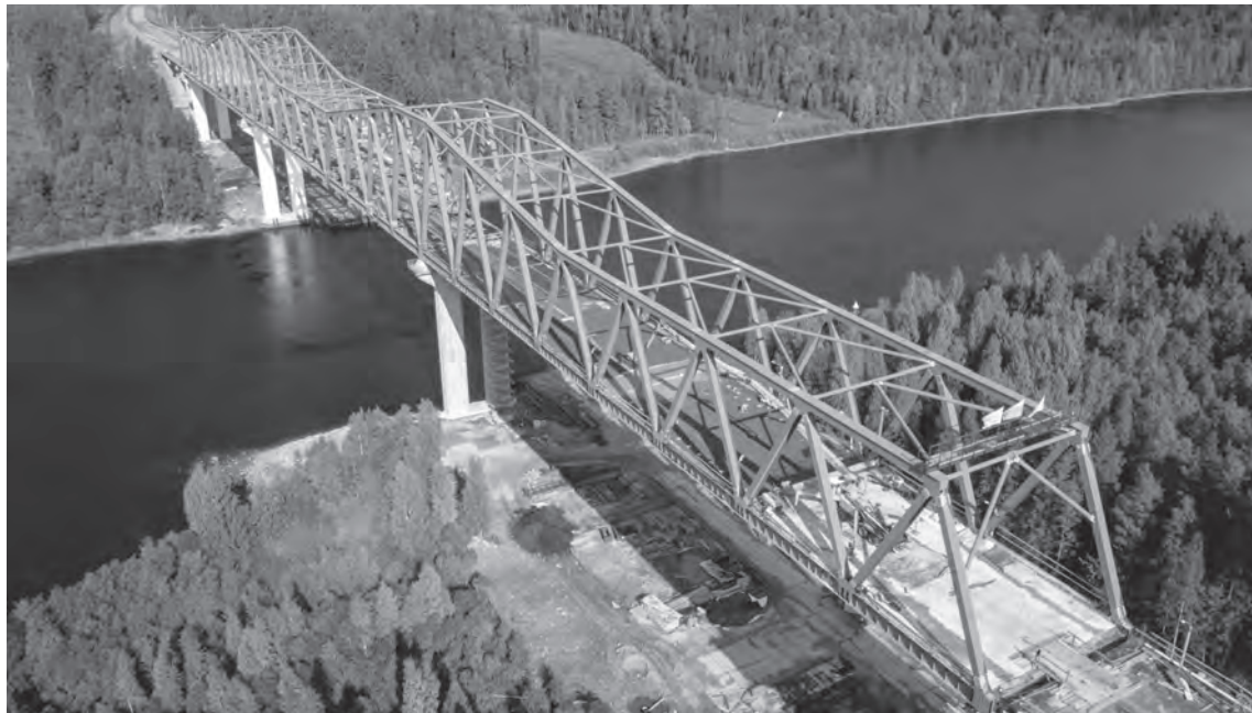
Строительство моста через Свирь идёт с применением технологии литого асфальта

— Подрядчик работает быстро, область и Минтранс договариваются о предоставлении федеральных субсидий, чтобы мосты строились ещё быстрее. Ориентир по запуску рабочего движения — следующий год. Если говорить о Подпорожье, то уже есть проект второй очереди моста со строительством тоннеля под железной дорогой и выводом транспорта на Мурманское шоссе в обход города.