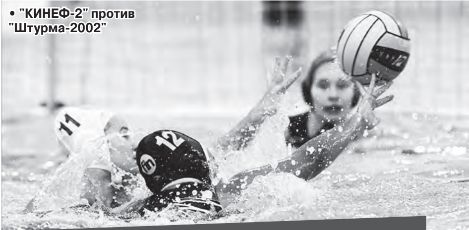
• «КИНЕФ-2» против «Штурма-2002»

счетом 9:10, также один мяч молодые киришанки уступили в напряженной борьбе петербургской «Диане» (11:12), а с командой «КИНЕФ-Сургутнефтегаз» молодежь сыграла с результатом 9:17.