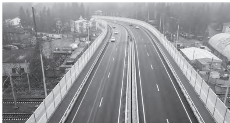
Тротуары на путепроводе во Всеволожске — в цветах города

СТАС БУТЕНКО, ФОТО: ПРЕСС-СЛУЖБА КОМИТЕТА ПО ДОРОЖНОМУ ХОЗЯЙСТВУ