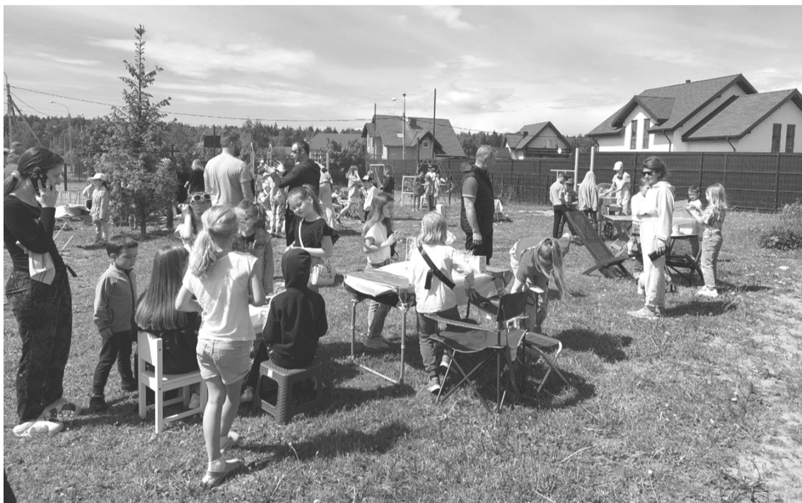
Праздничные мероприятия изменили жизнь Янино-1 и уже стали доброй традицией