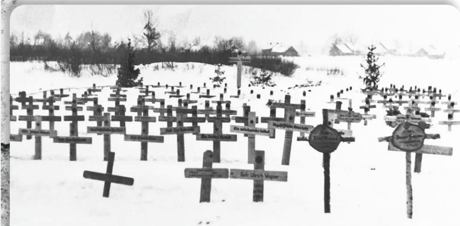
• Они пришли на Киришскую землю в надежде заработать почетные немецкие железные кресты...но "удостоились" берёзовых...

Да, у плацдарма было одно преимущество тактического характера - восточный берег реки Волхов был несколько выше западного. Если бы наши подразделения его занимали, то они могли бы легко отслеживать немецкие позиции на западном берегу Волхова. Этим преимуществом немцы себя и утешали. Х.Стахов отмечал, что каждый месяц сражения на Волхове показывал немецкому командованию, что о «стратегическом превосходстве как основе дальнейшего продвижения на север и восток речи уже больше нет. Слишком мал плацдарм для этого».