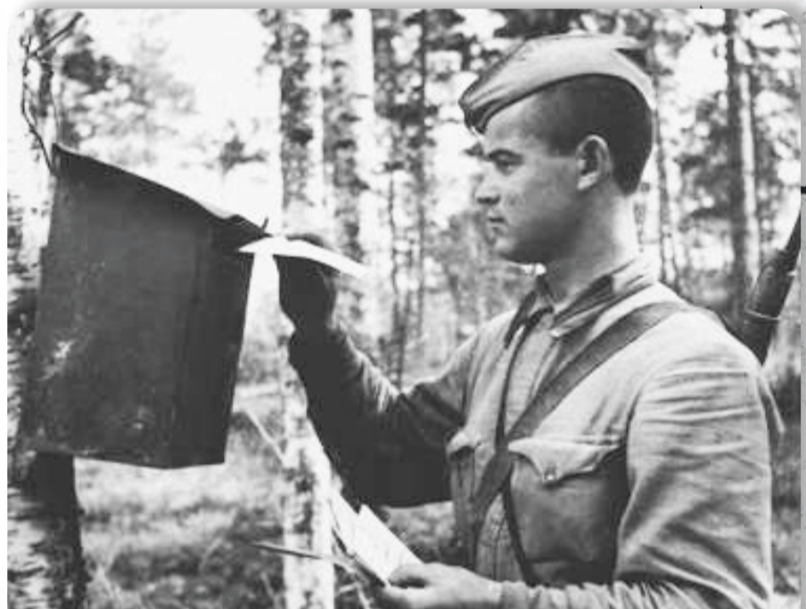
• 311-я сд. Лети до дома, фронтовая весточка... Снято в стрелковом батальоне в период позиционной войны под Новыми Киришами в июле 1942 г. (Ленинградская область).

И хотя книга написана с определенных идеологических позиций немецкого автора, она не только доносит до нас шокирующие факты о жестоких