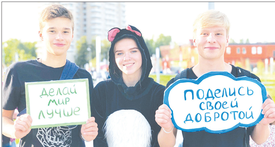
• День добрых дел в Киришах.

Центр станет площадкой для обучения волонтеров основам добровольческой деятельности, а также займется сопровождением культурных и патриотических региональных мероприятий. Также в его ведении будет координация работы муниципальных добровольческих ресурсных центров, которые планируется организовать в каждом районе области.