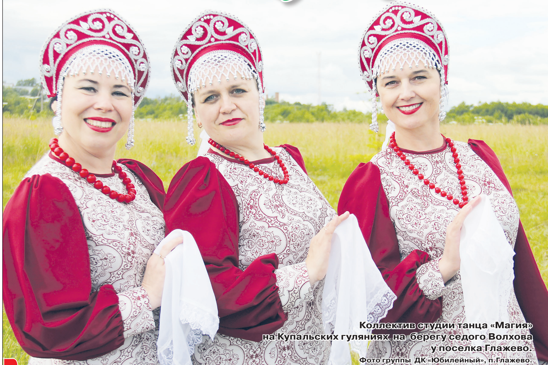
Коллектив студии танца «Магия» на Купальских гуляниях на берегу седого Волхова у поселка Глажево.