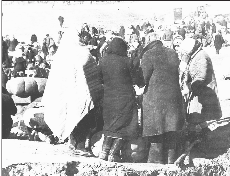
Эвакуируемые жители Ленинграда в ожидании транспорта. Кобона, 1942 год

Продовольствие доставляли в блокадный город по Дороге жизни, часть трассы которой проходила по Мгинскому району. На юго-восточном побережье Ладожского озера находится небольшая деревня Кобона. Отсюда 23 ноября 1941 года вышла колонна из 60 машин. Они преодолели по неокрепшему еще льду озера 30 км до порта Осиновец во Всеволожском районе, и блокадный город получил 33 тонны муки. Начала работать ледовая трасса Дороги жизни, благодаря которой только за зиму 1941/1942 г. из Ленинграда вывез-