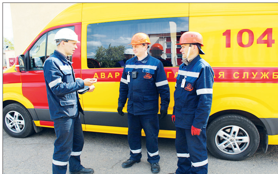
• Газовая служба г.Кириши - шоссе Энтузиастов, 4а.

Договор на техническое обслуживание, заключенный до сентября 2017 года необходимо перезаключить. Связано это в первую очередь с тем, что в 2017 году были внесены поправки в Правила №410, после которых, изменился срок проведения обязательного технического обслуживания газового оборудования. Если раньше такое обслуживание проводилось не реже, чем один раз в три года, то с 9 сентября 2017 года собственник обязан проводить ТО ВДГО/ВКГО не реже одного раза в год.