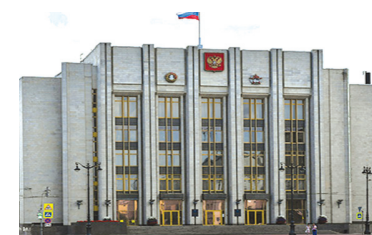
Здание правительства Ленинградской области. Санкт-Петербург, Суворовский проспект, 67.