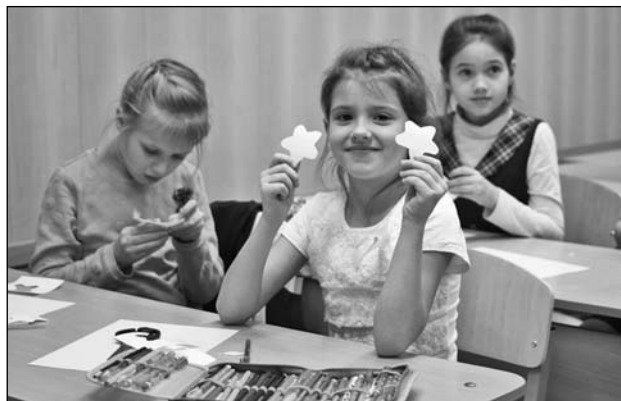
• Фото Дворца творчества им. Л.Н.Маклаковой.

Инспектор рассказал детям, что за последние 10 месяцев в Киришском районе с участием детей случились 18 ДТП, где пострадал 21 ребёнок. Неред-