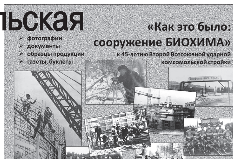
•Фото Инны Ефимовой.

- Промышленные объекты масштабной ударной комсомольской стройки на площади в 100 гектаров можно детально рассмотреть на макете БХЗ, а также познакомиться с образцами продукции, выпускаемой на заводе в разные периоды времени, - продолжает рассказ методист музея. - Столь полное отражение на выставке истории второй ударной комсомольской стройки было бы невозможным без экспонатов, бережно собранных,