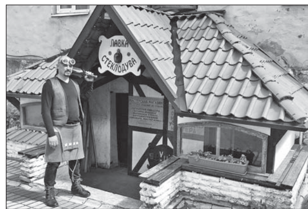
• Лавка стеклодува в Выборге - одно из мест, которые посетили блогеры Петербурга.