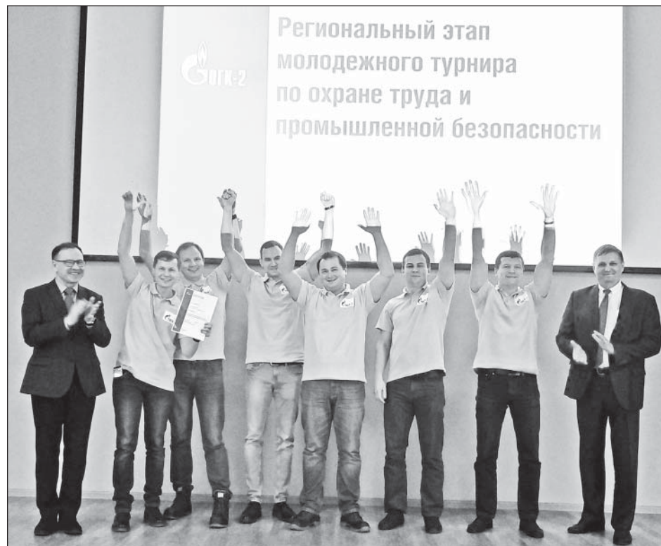
• Киришские энергетики рады своему успеху.

Команда Киришской ГРЭС победила в региональном этапе молодежного турнира по охране труда. Он прошел на киришской электростанции, где встретились пять коллективов - команды принимающей стороны, а также Череповецкой, Псковской, Рязанской ГРЭС и исполнительного аппарата компании. Об этом сообщила пресс-служба КиГРЭС.