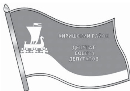
ИЗОБРАЖЕНИЕ НАГРУДНОГО ЗНАКА ДЕПУТАТА МУНИЦИПАЛЬНОГО ОБРАЗОВАНИЯ КИРИШСКИЙ МУНИЦИПАЛЬНЫЙ РАЙОН ЛЕНИНГРАДСКОЙ ОБЛАСТИ

На октябрьском заседании районного совета депутатов рассмотрены вопросы присвоения жителям Киришского района почетных званий и награждения почетными знаками.