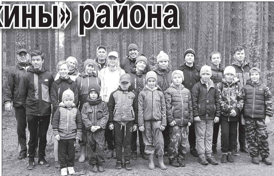
Активисты движения «За чистоту «жемчужины» района» - представители разных поколений, организаций и содружеств.

По материалам сообщества «ВПК «ГТО (СР)» интернет-сайта «ВКонтакте».