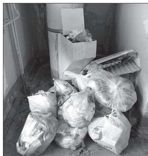
Вот так практически каждый день выглядит мусоропровод между первым и вторым этажами в доме №14 на улице Декабристов Бестужевых. Жаль, что фото не передает «аромат».