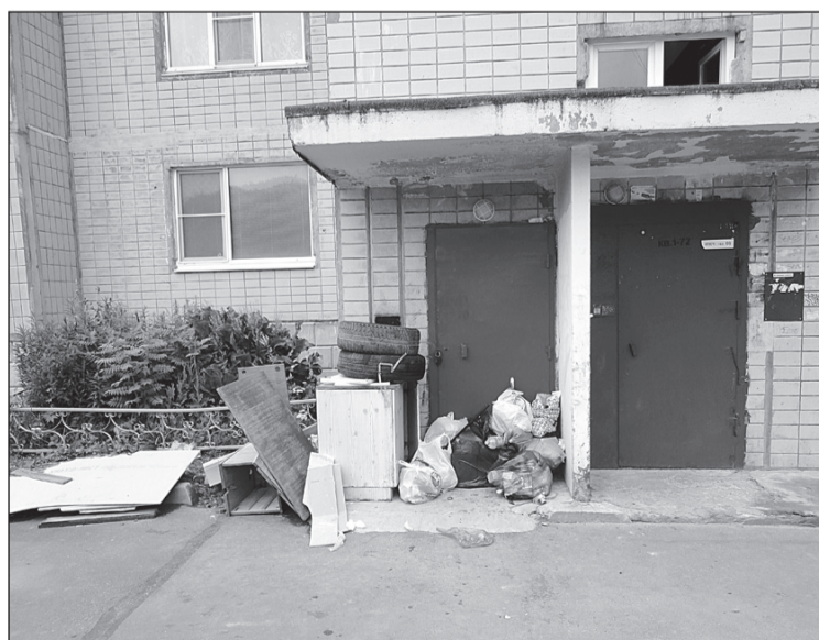
А это около подъезда. Если мусор начинают выносить с вечера пятницы, то за два дня образуется целая свалка. Мусор из разорванных пакетов разносится по всей территории.