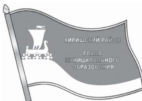
ИЗОБРАЖЕНИЕ НАГРУДНОГО ЗНАКА ГЛАВЫ МУНИЦИПАЛЬНОГО ОБРАЗОВАНИЯ КИРИШСКИЙ МУНИЦИПАЛЬНЫЙ РАЙОН ЛЕНИНГРАДСКОЙ ОБЛАСТИ

Утверждено Положение о звании «Почетный гражданин Киришского муниципального района». Стоит отметить, что подобное звание уже присваивается на уровне города Кириши, в списке почетных граждан города - 43 имени. Теперь звание почетного гражданина, как высший знак общественной признательности, будет присваиваться и жителям Киришского района. Критерии присвоения звания включают заслуги перед населением Киришского муниципального района, совершенные мужественных и героических поступков, заслуги в области науки, культуры, спорта, общественной, духовной и нравственной жизни, вклад в сохранение исторического и культурного наследия, в социально-экономическое развитие Киришского муниципального района, повышение его авторитета на территории Российской Федерации и за рубежом. Почетное звание