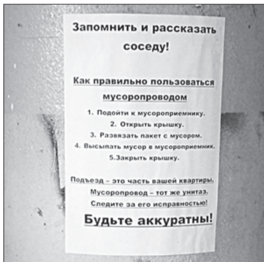
Памятка на мусоропроводе.

Однако индивидуумы сначала дома копят мусор в большие пластиковые пакеты, а потом выносят их в подъезд и ставят (?) к мусоропроводу или забывают его этими мешками. А другие несут свои отходы на улицу и «украшают» ими вход (?) в мусороприемную камеру, которая расположена рядом с подъездом.