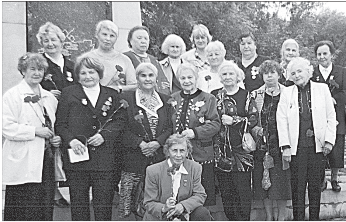
● Одна из встреч киришан - бывших жителей блокадного Ленинграда.