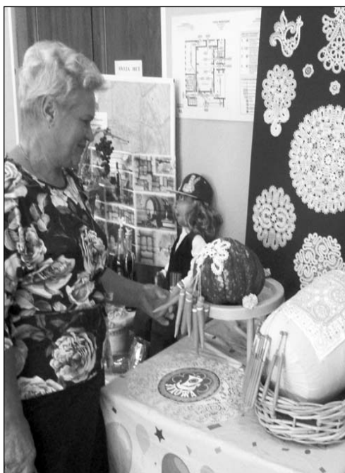
На выставке в Пчеве было представлено знаменитое захожское кружево.