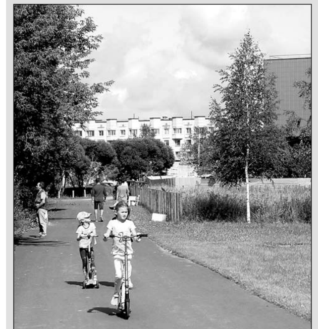
Фото Жанны ИВАНОВОЙ.

Пресс-служба Киришского муниципального района.