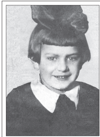
● Валентина Суетина, 1939 г.