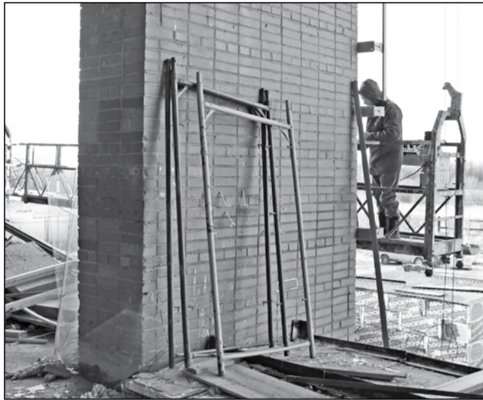
В процессе обследования Дворца творчества были даны рекомендации для усиления некоторых несущих стен.

Дополнительное финансирование из районного бюджета в сумме около 8 млн рублей направлено на капремонт Дворца творчества им.Л.Н.Маклаковой: в процессе обследования здания были даны рекомендации для усиления некоторых несущих стен, кроме того, в проекте не были предусмотрены средства на наружное освещение здания и автоматическую установку пожаро-