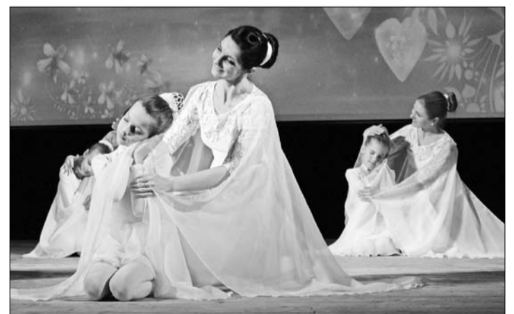
Творческие коллективы подготовили к концерту самые лучшие номера.

Чтобы помочь родителям Вероники, участники добровольческих киришских объединений провели несколько акций. Удалось собрать примерно треть необходимой суммы. Тогда студия танца «Магия», благотворительный фонд «Ангел надежды» и волонтерская группа «Я умею помогать» организовали благотворительный концерт. В нем приняли участие творческие коллективы Школы искусств, студия танца «Магия», другие