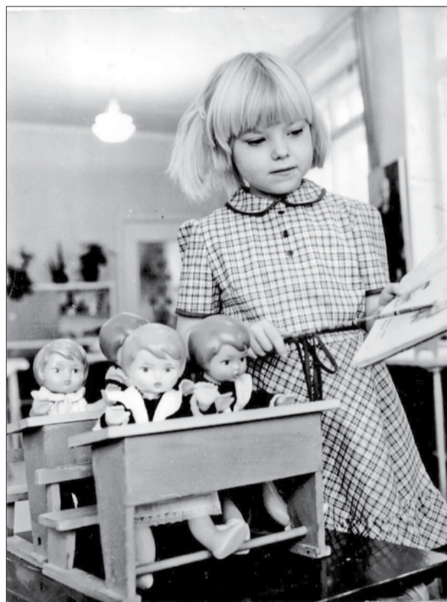
Будущая учительница.