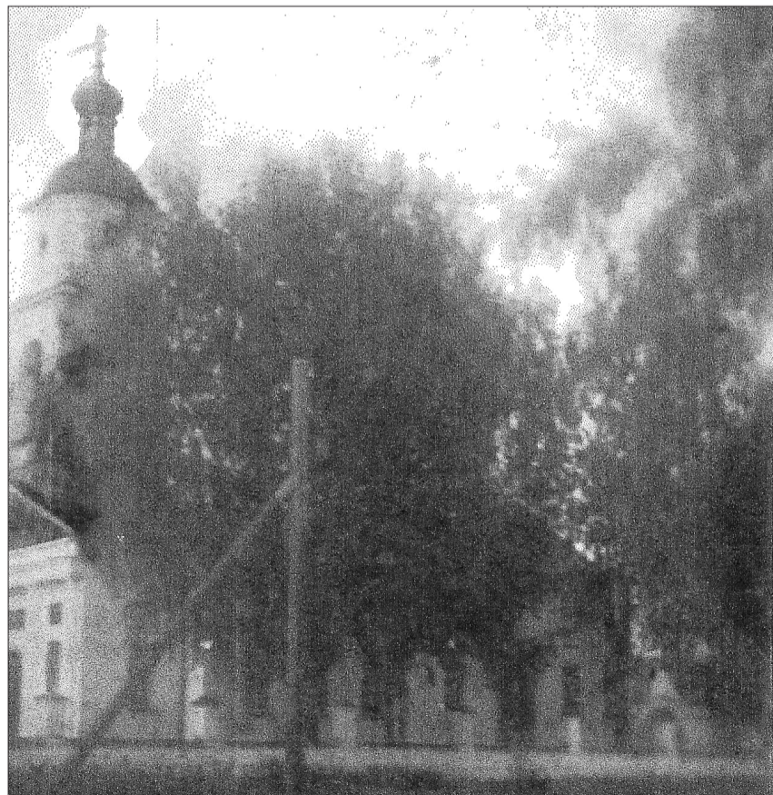
Церковь деревни Городище.

именем Николая Чудотворца (бабушка мне рассказывала). Будто везли икону Николая Чудотворца из Новгорода в Ладогу на судне. Случилась буря, задержала она судно прямо у нашего села. Пристали к берегу – плыть дальше невозможно. Тут буря кончилась. Стали барку в воду стаскивать – никак не получается. Кто-то и говорит: «Давайте все выйдем, пустую столкнем». Тут и решили, что, видно, Николай Чудотворец не хочет в Ладоге быть, а желает здесь остаться. Так и поставили церковь, а престольным праздником стал праздник Николая Чудотворца... А после войны разрушенную церковь растащили – отстраиваться».