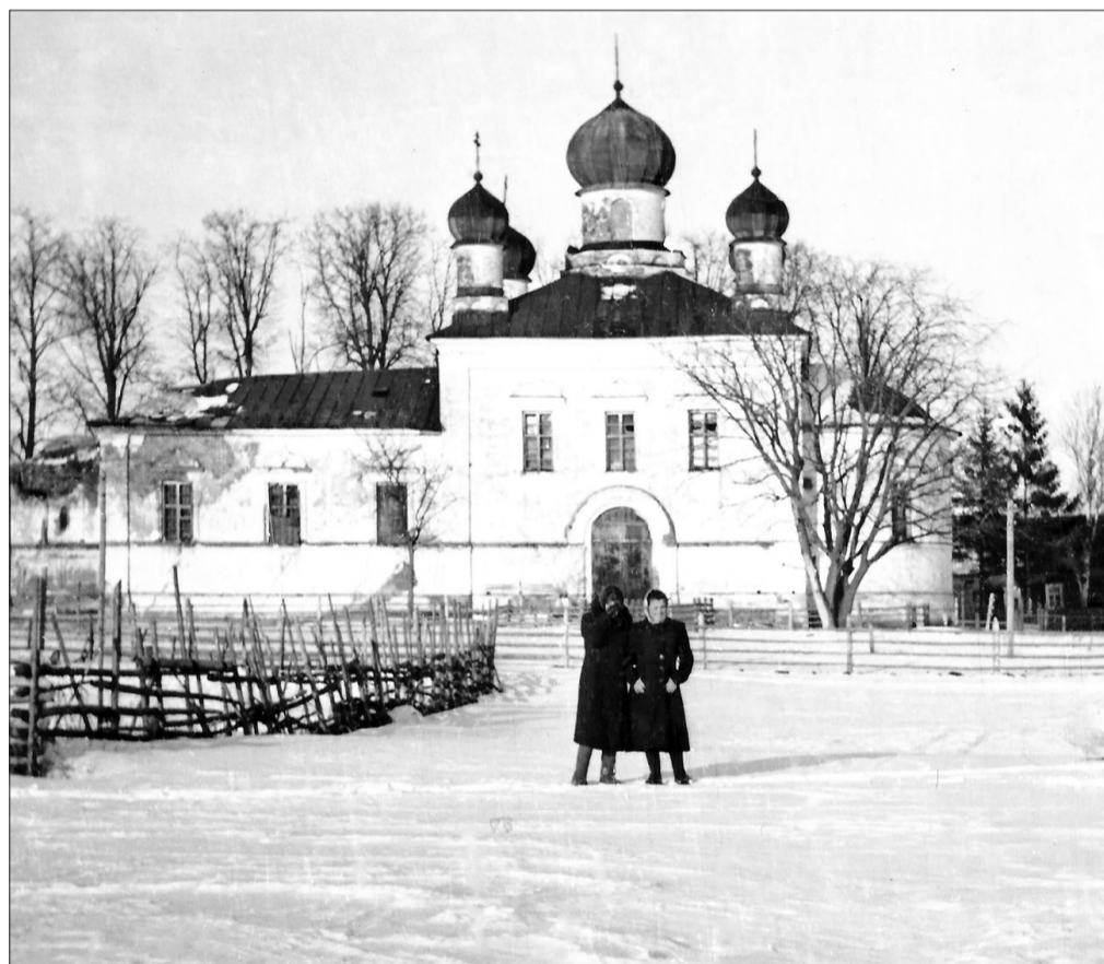
Церковь в Мотохове.