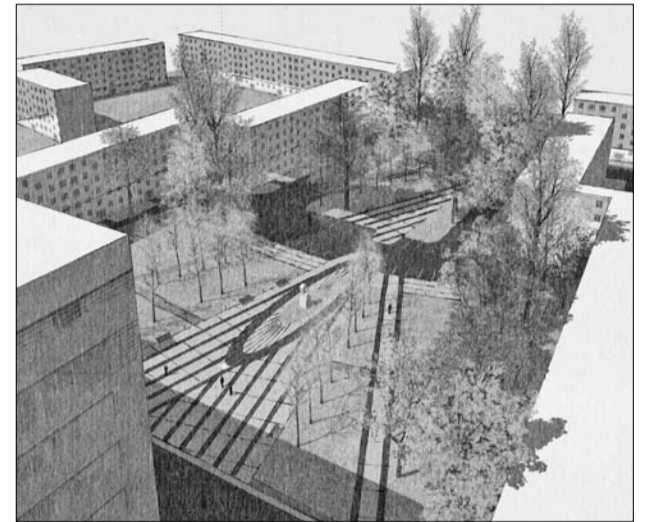
Проект благоустройства территории за заводоуправлением №4 КИНЕФ.