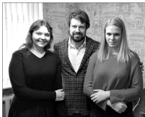
Диана и Вера с актером Сергеем Перегудовым.