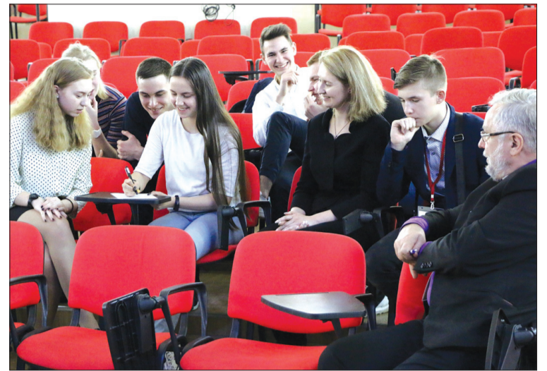
Участники деловой игры.